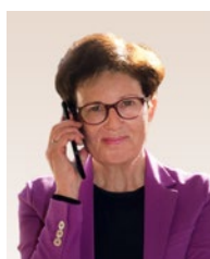
Gudrun Brendel-Fischer Integrationsbeauftragte der Bayerischen Staatsregierung