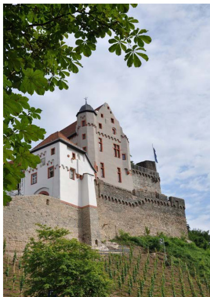
Burg Alzenau