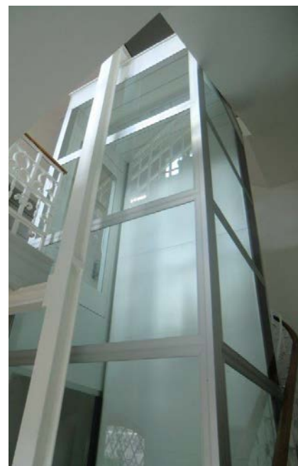
Stahlglasskonstruktion Lift