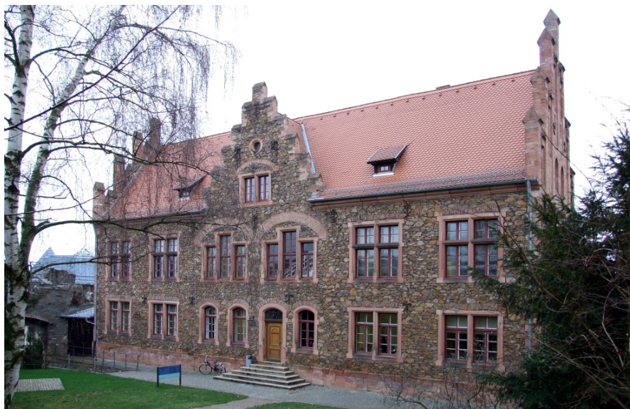
Amtsgericht Alzenau