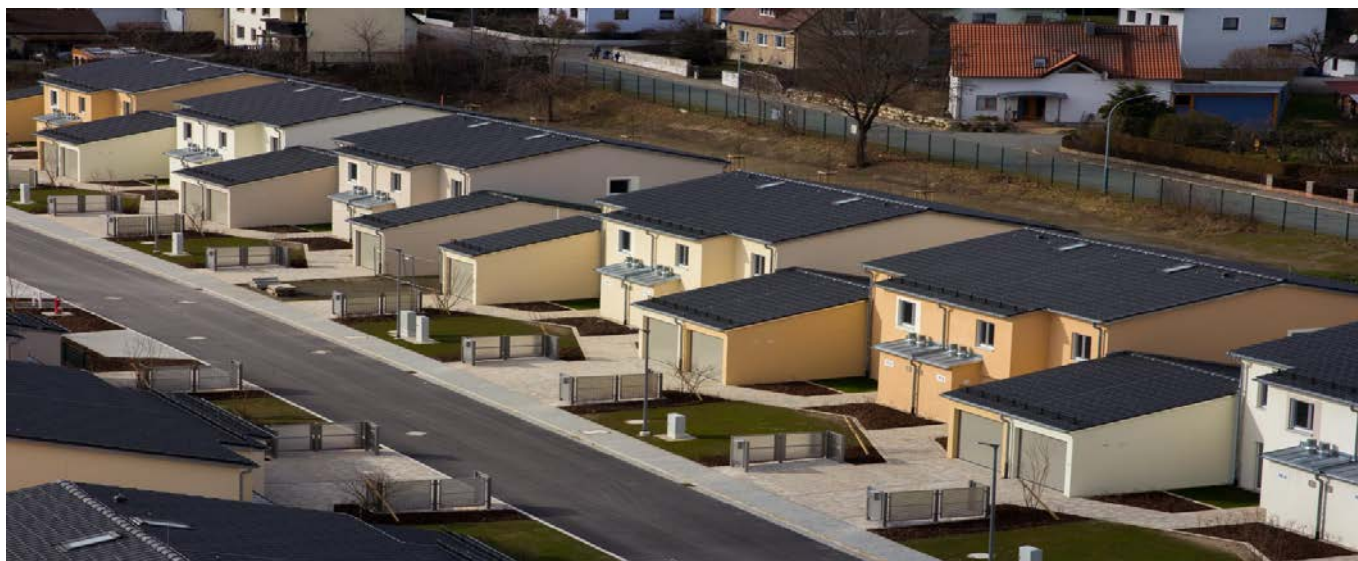
Neue Doppelhäuser im Ostlager TrÜbPI Grafenwöhr