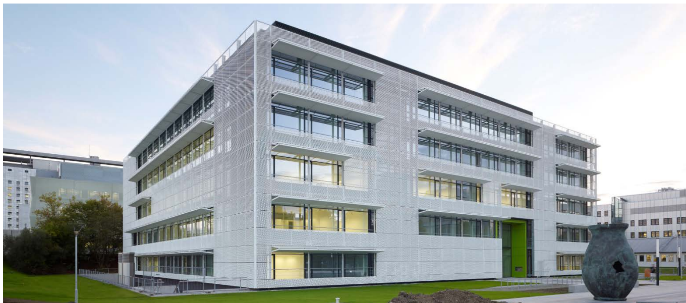
Haupteingang mit Kunst am Bau „Das Ich“ (Foto: Müller-Naumann)