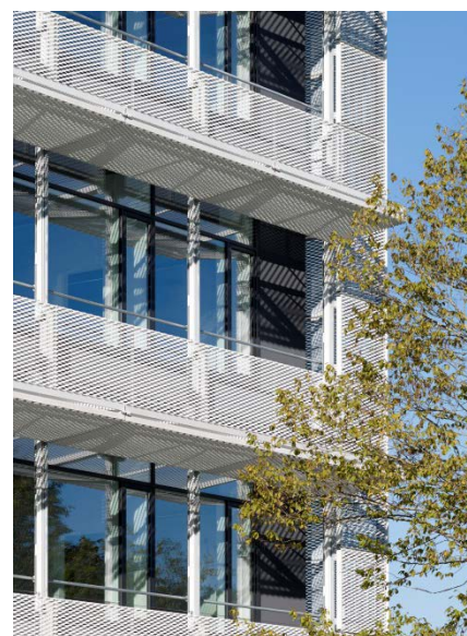
Detail Fassade