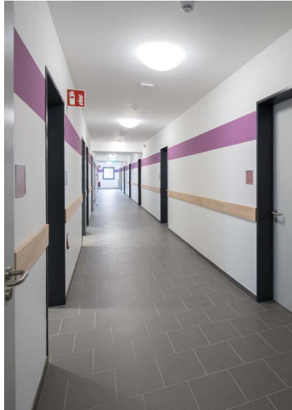
Unterkünfte, Flur