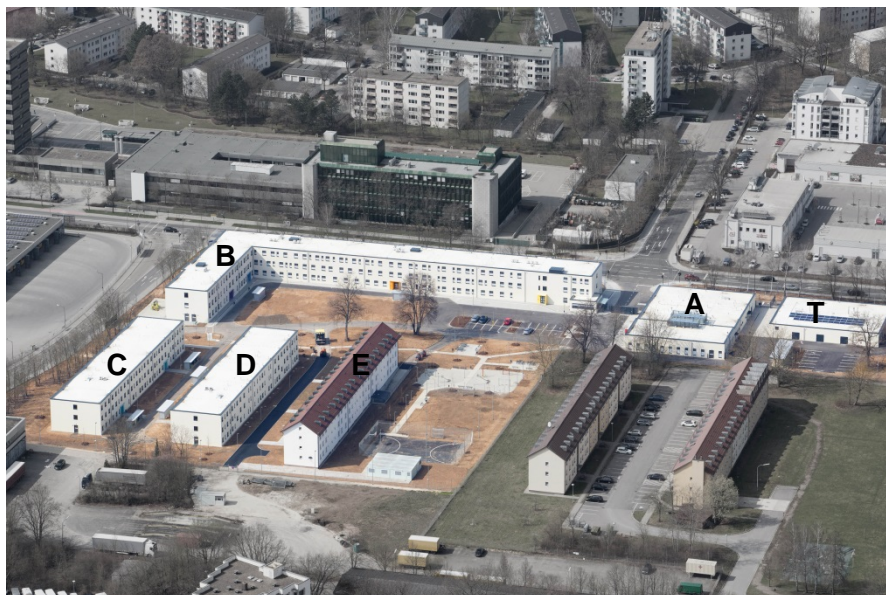
Luftbild März 2017

Städtebaulich bildet die EAE zum öffentlichen Raum eine straßenbegleitende Bebauung. Die bau-