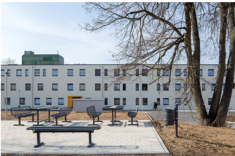
Außenbereich mit Aufenthaltsmöglichkeit