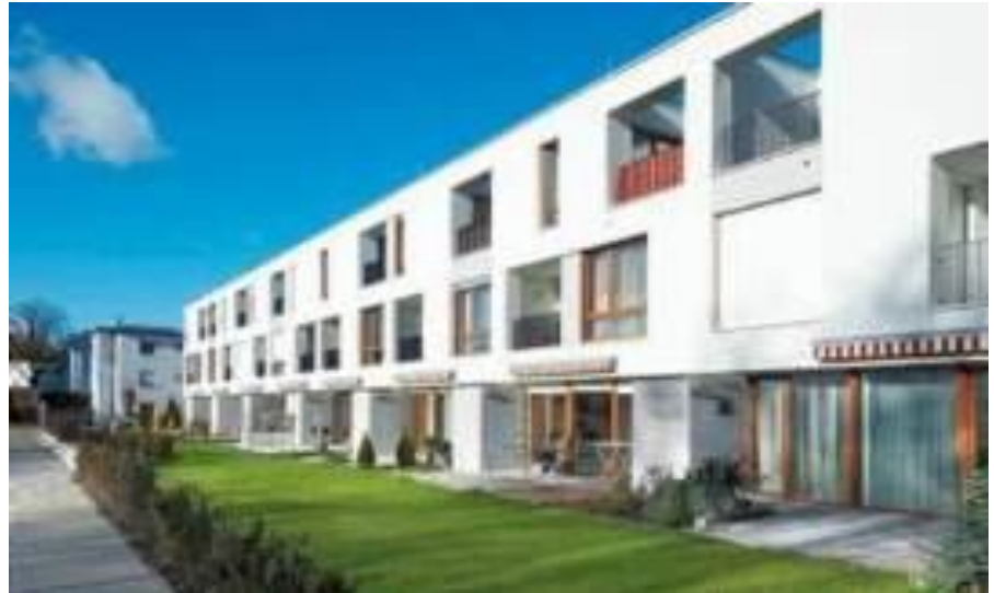
Zweiter Bauabschnitt mit Senioren-Wohngemeinschaften im Erdgeschoß

Straubing Sedanstraße/ Paul-Münch-Straße